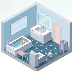
Hygiène des mains