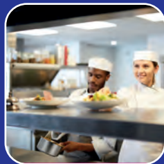
Food Service & Catering