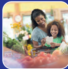
Vente au détail