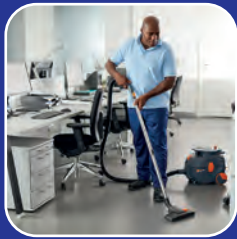
Nettoyage des bâtiments

Nous vous proposons des solutions de nettoyage individuelles - adaptées à chaque secteur :